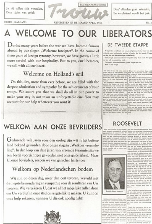
April 1945: het bevrijdingsnummer van het Friese Trouw .

Trouw was niet ‘alleen maar’ een verzetsblad. Vanaf de oprichting was Trouw ‘een duidelijk uitgesproken politiek orgaan, dat evenwel, ook en met name in zijn redactie, volkomen zelfstandig was en niet gebonden was aan eenige politieke organisatie’. Elke verspreider, ook als hij of zij maar zo nu en dan een vluchtige blik in de krant wierp, had dat kunnen weten. ‘Men kende – of althans kon kennen – wat Trouw najoeg.’ En meer dan eens had de redactie in gesprekken met medewerkers die de gedachtenwereld van Trouw vreemd was, gezegd ‘dat men het zou kunnen begrijpen, indien zoodanige