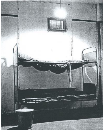
Cel in Haaren. Van oktober 1941 tot begin januari 1943 was het grootseminarie vooral als gijzelaarskamp in gebruik; daarna, tot september 1944, als Polizeigefängnis.