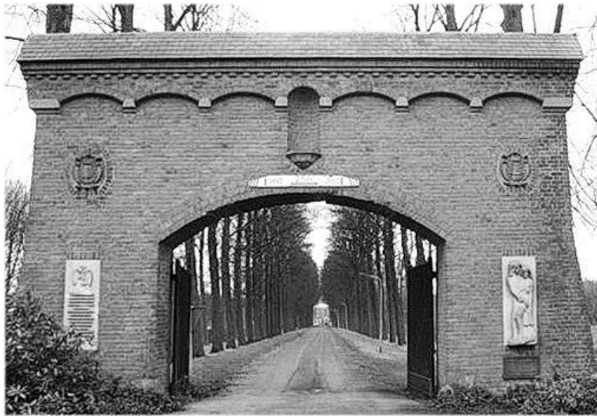
FOTO GEDENKPLAATS HAAREN

Wie over de N65 van Den Bosch naar Tilburg rijdt ziet ter hoogte van Haaren, aan de parallelweg, een stenen poort staan. De poort, gebouwd in 1939, geeft toegang tot een lange oprijlaan die eindigt bij een imposant pand dat bijna 125 jaar als grootseminarie dienst heeft gedaan. Hier zijn duizenden priesters opgeleid. Tijdens de Duitse bezetting had het grootseminariegebouw een andere bestemming. Vooraanstaande politici, zakenlieden en andere notabelen werden er als gijzelaars vastgehouden. Ook verzetsstrijders gingen de kaarsrechte weg tussen de dubbele rij lindenbomen; zij werden in Haaren verhoord en moesten er hun proces afwachten. Hun lotgevallen zijn in de loop der jaren fragmentarisch verteld, in mondelinge en gedrukte vorm. Maar 'het grote verhaal', van een grootseminariegebouw dat drie oorlogsjaren lang als Geisellager en Polizeigefängnis dienst heeft gedaan en zowel grote namen als gewone burgers tussen haar muren heeft gehad, is nog altijd niet geschreven.