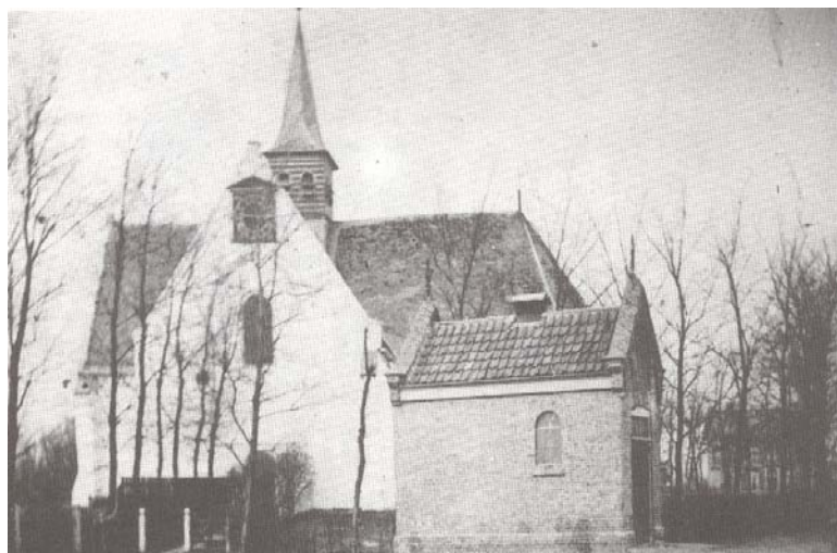
De kerk ca 1885

Daarom: lang leve de fotografie! Onderstaande foto is genomen vanaf de Bovenweg, rond 1885. Het gebouwtje op de voorgrond is het brandspuithuisje, dat in 1879 werd gebouwd. Rechts van het huisje, door de bomen, is de voormalige pastorie zichtbaar.