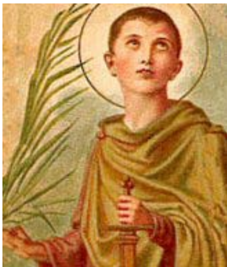
Sint Pancratius (290-304). Hij geldt als een van de vier ijsheiligen. Zijn naamdag is 12 mei.

Het verzoekschrift aan de Utrechtse decaan was ondertekend door de ‘procuratoren’ van de kapel, anders gezegd: door de Vroners die met het financieel beheer van de kerk waren belast. Of mogen we inmiddels zeggen: Pancrassers? In een handvest van Filips de Goede uit het jaar 1434 wordt het dorp namelijk niet als Vronen maar als ‘Ste Pancras’ aangeduid. Als het dorp naar de kapel is hernoemd, zou dit betekenen dat de bouw van de kerk vóór 1434 moet worden gedateerd. In hun verzoekschrift van 1487 aan de decaan in Utrecht noemden de parochianen hun dorp echter nog gewoon ‘Vroon’. Hierop afgaand zou de naam van de kerk pas naderhand op het dorp zijn overgegaan.