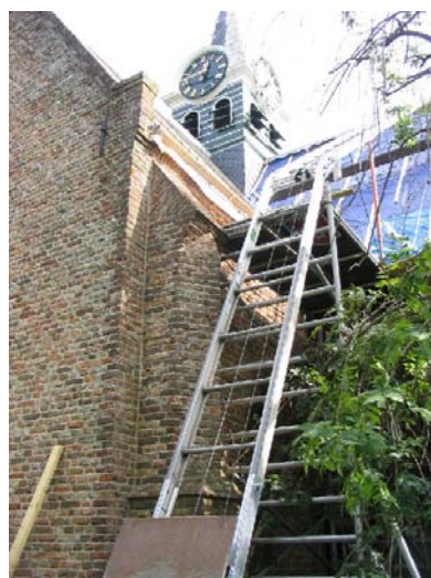
Najaar 2007, de kerk krijgt een nieuw dak.

In november 2006 werd de stichting ‘Vrienden van de Witte Kerk’ opgericht die zich ging inspannen voor het behoud en onderhoud van het kerkgebouw.