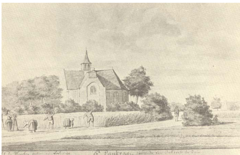
Gravure van H. de Winter, 1744

Visueel komen we meer over de kerk aan de weet. De oudste afbeelding dateert van 1725. Het betreft een kopergravure die is gemaakt door Abraham Rademaker. Hij nam de gravure op in zijn verzamelwerk Kabinet van Nederlandsche en Kleefsche outheden . Rademaker gold in zijn dagen als een bekende tekenaar en miniatuurschilder. Maar heeft hij de kerk in Sint-Pancras met eigen ogen gezien? Vaak tekende hij zijn objecten na, uit boeken of van schilderijen en medaillons. Hij werkte doorgaans in opdracht, van vermogende kooplieden. Hun wensen kwamen de werkelijkheidszin van Rademakers werk niet ten goede.