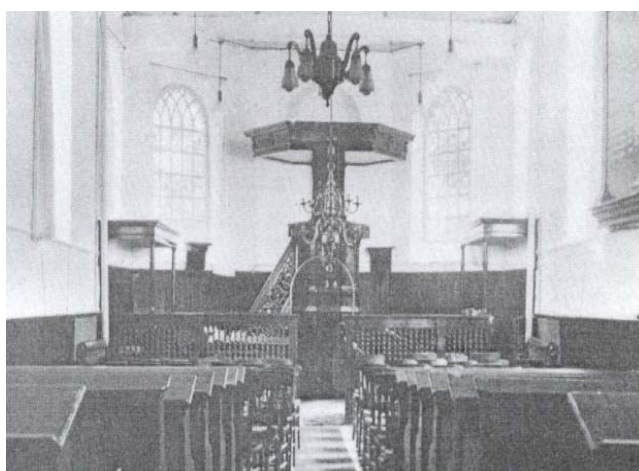
Het oude interieur van de kerk; de preekstoel staat tegen de oostmuur

Door middel van collectes en donaties werd zeventuizend gulden bijeengebracht. Vierduizend gulden werd uit de financiële reserves gehaald. Het college van B&W zegde in oktober 1949 een subsidie van 7750 gulden toe, zijnde tien procent van de totale restauratiekosten. Bij elkaar 18.750 gulden, een bedrag dat niet eens toereikend was voor het 'kleine plan'. In december 1949 moesten de werkzaamheden worden stilgelegd.