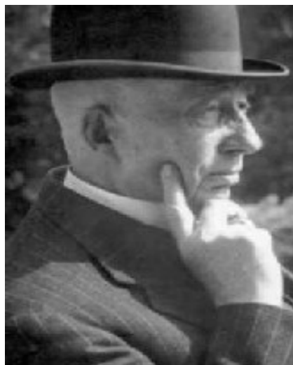
Hendrikus Colijn